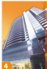
4 Prosperity Place 泓富廣場