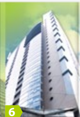
6 Prosperity Center Property (portion) 創富中心 (部分)