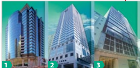
1 The Metropolis Tower 都會大廈