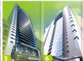
5 Trendy Centre 潮流工貿中心