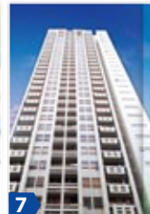
7 New Treasure Centre Property (portion) 新寶中心 (部分)